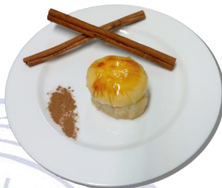
{ Postre Músico