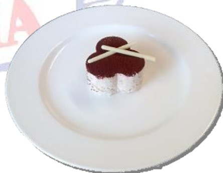
Mouss de tiramisú }