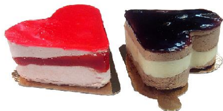
{ Semifríos corazón